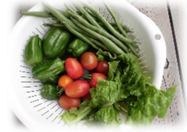
普段のエコハウスの1コマ